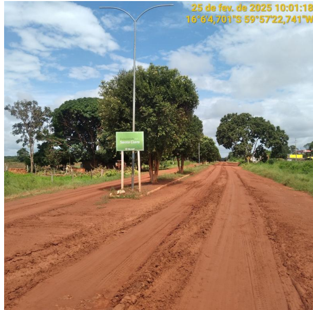
Foto 57 – Final do Trecho não pavimentado MT-265 município de Pontes e Lacerda-MT.