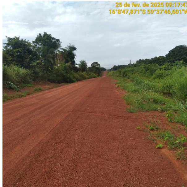
Foto 49 – Trecho não pavimentado MT-473 município de Pontes e Lacerda-MT.