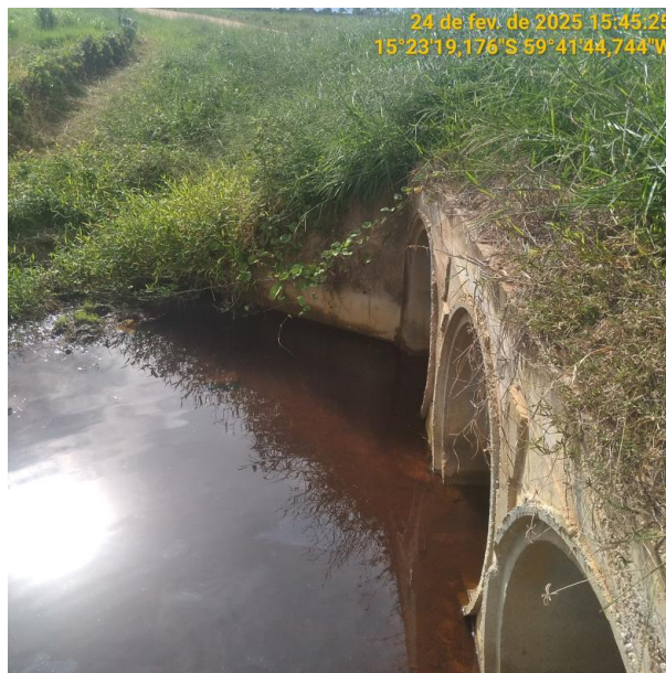
Foto 24 – Bueiro 08 - Trecho não pavimentado MT-245 município de Pontes e Lacerda-MT.