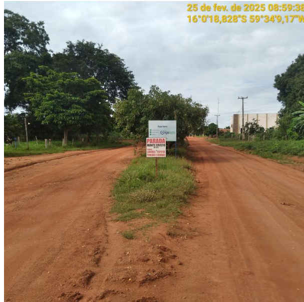
Foto 47 –Trecho não pavimentado MT-473 município de Pontes e Lacerda-MT.