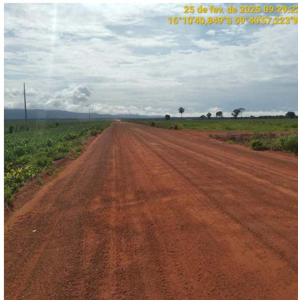
Foto 52 – Trecho não pavimentado MT-265 município de Pontes e Lacerda-MT.