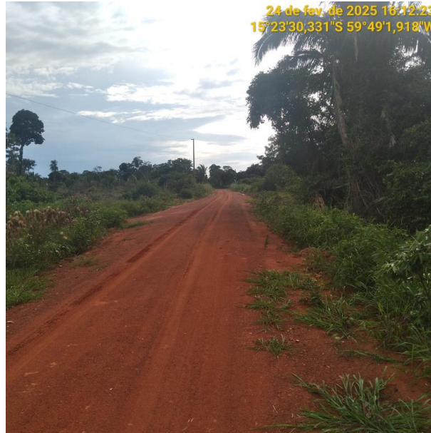
Foto 33 – Trecho não pavimentado MT-245 município de Pontes e Lacerda-MT.