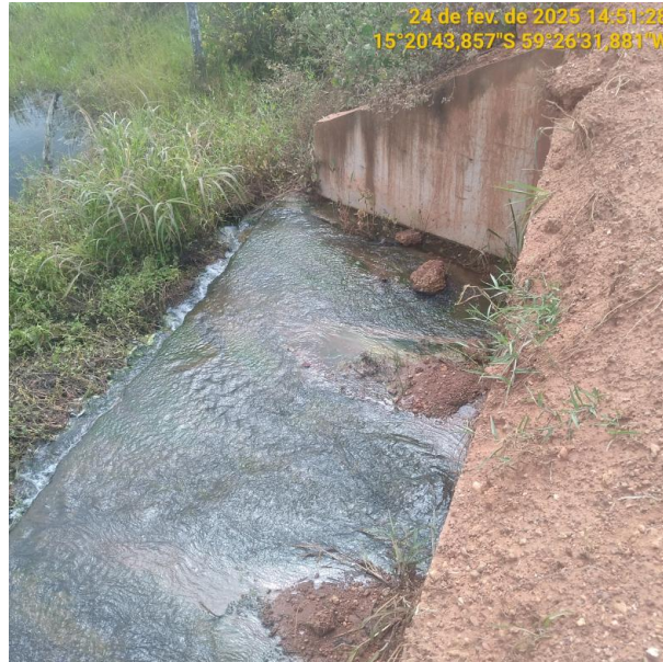
Foto 05 – Bueiro 01 do trecho não pavimentado MT-245 município de Pontes e Lacerda-MT.