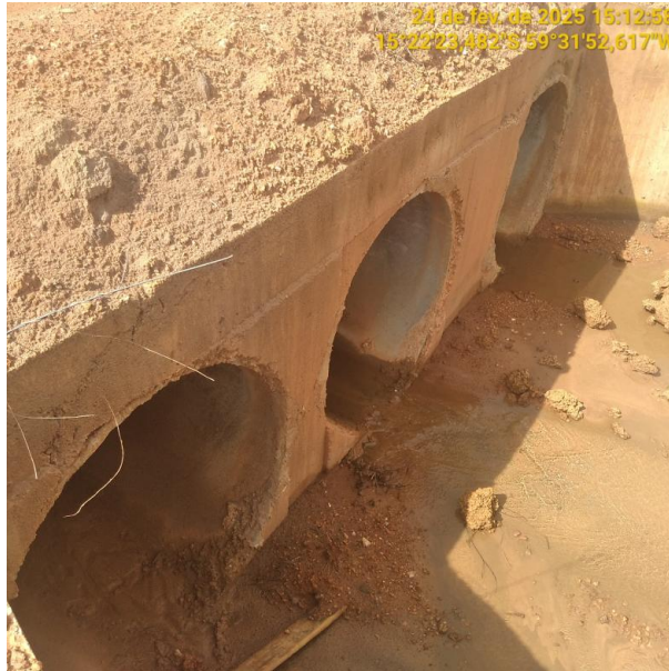
Foto 15 – Bueiro 03 do trecho não pavimentado MT-245 município de Pontes e Lacerda-MT.