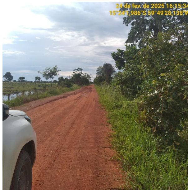
Foto 34 – Trecho não pavimentado MT-245 município de Pontes e Lacerda-MT.