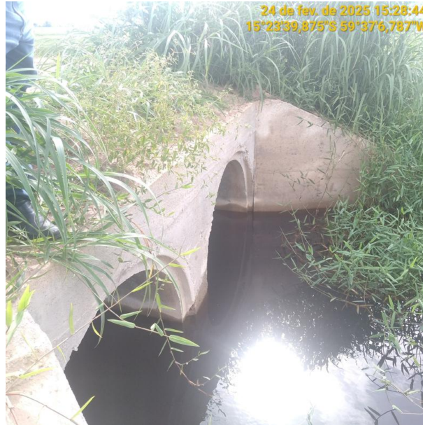
Foto 19 – Bueiro 04 do trecho não pavimentado MT-245 município de Pontes e Lacerda-MT.