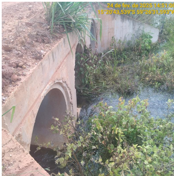
Foto 04 – Bueiro 01 do trecho não pavimentado MT-245 município de Pontes e Lacerda-MT.