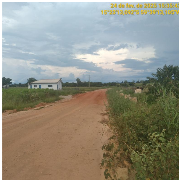
Foto 22 – Trecho não pavimentado MT-245 município de Pontes e Lacerda-MT.