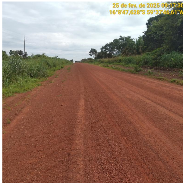
Foto 48 –Trecho não pavimentado MT-473 município de Pontes e Lacerda-MT.