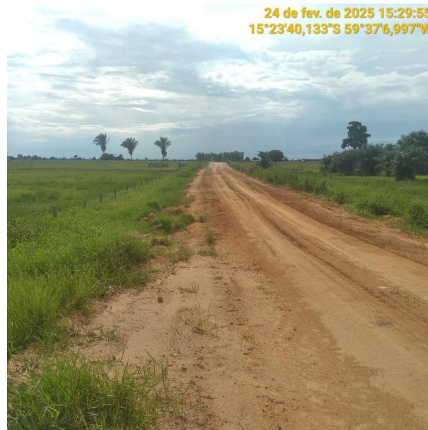
Foto 20 – Trecho não pavimentado MT-245 município de Pontes e Lacerda-MT.