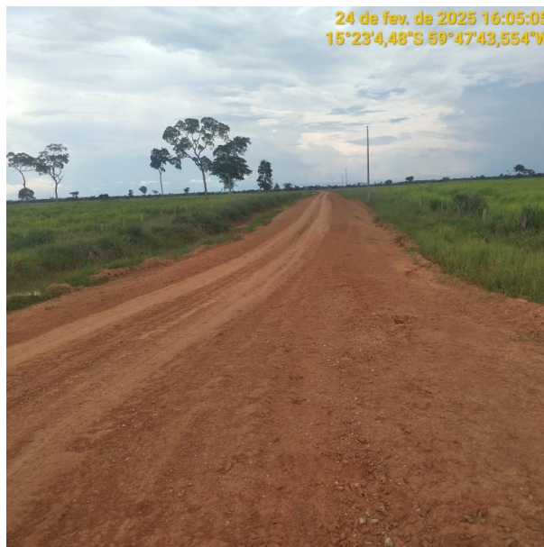
Foto 32 – Trecho não pavimentado MT-245 município de Pontes e Lacerda-MT.