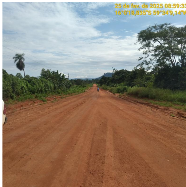
Foto 46 –Trecho não pavimentado MT-473 município de Pontes e Lacerda-MT.