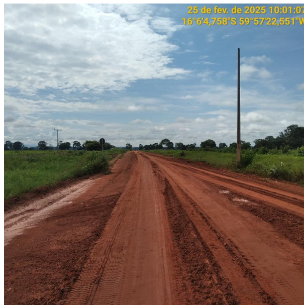
Foto 56 –Trecho não pavimentado MT-265 município de Pontes e Lacerda-MT.