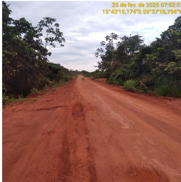
Foto 35 – Início do Trecho não pavimentado MT-473 município de Pontes e Lacerda-MT.