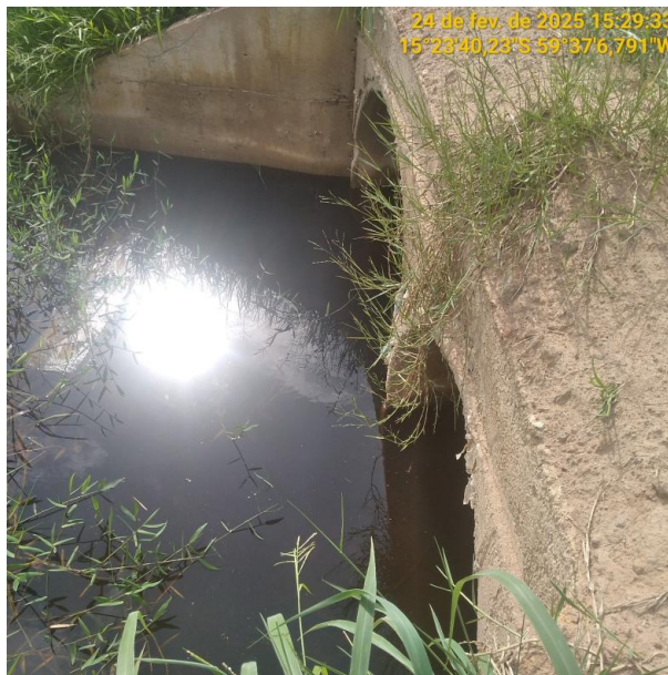
Foto 18 – Bueiro 04 do trecho não pavimentado MT-245 município de Pontes e Lacerda-MT.