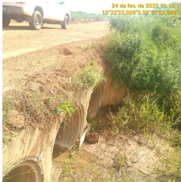
Foto 14 – Bueiro 03 do trecho não pavimentado MT-245 município de Pontes e Lacerda-MT.