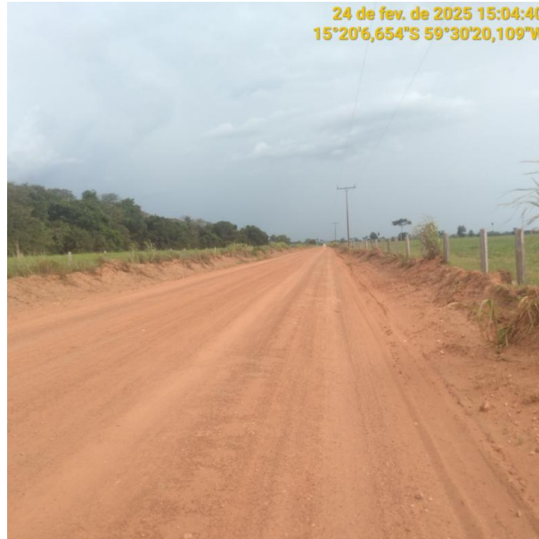
Foto 13 – Trecho não pavimentado MT-245 município de Pontes e Lacerda-MT.