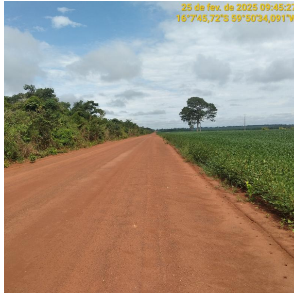
Foto 55 –Trecho não pavimentado MT-265 município de Pontes e Lacerda-MT.