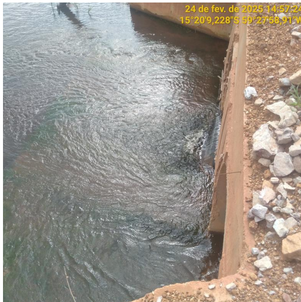
Foto 10 – Bueiro 02 do trecho não pavimentado MT-245 município de Pontes e Lacerda-MT.