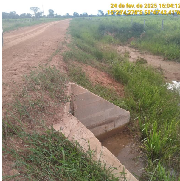
Foto 29 – Bueiro 09 - Trecho não pavimentado MT-245 município de Pontes e Lacerda-MT.