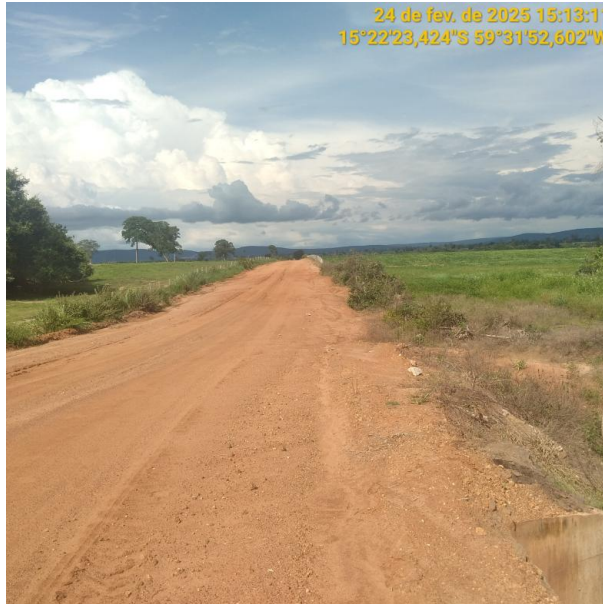
Foto 17 – Trecho não pavimentado MT-245 município de Pontes e Lacerda-MT.