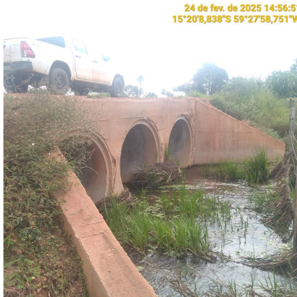
Foto 07 – Trecho não pavimentado MT-245 município de Pontes e Lacerda-MT.

24 de fev. de 2025 14:56:51 15°20'8,838"S 59°27'58,751"W