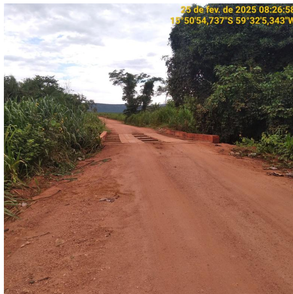
Foto 42 –Trecho não pavimentado MT-473 município de Pontes e Lacerda-MT.