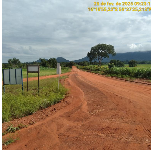
Foto 51 – Final Trecho MT-473 e Início Trecho MT-265 município de Pontes e Lacerda-MT.