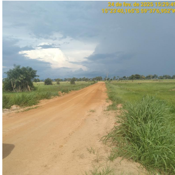
Foto 21 – Trecho não pavimentado MT-245 município de Pontes e Lacerda-MT.