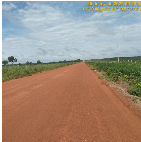
Foto 53 –Trecho não pavimentado MT-265 município de Pontes e Lacerda-MT.