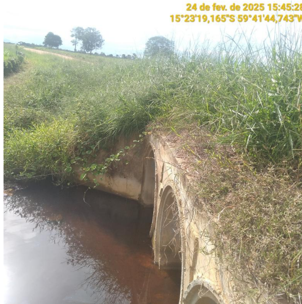
Foto 25 – Bueiro 08 - Trecho não pavimentado MT-245 município de Pontes e Lacerda-MT.