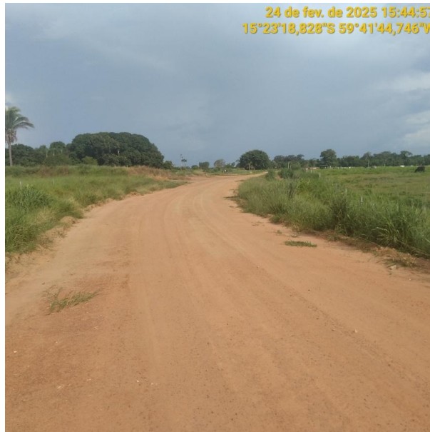
Foto 26 – Trecho não pavimentado MT-245 município de Pontes e Lacerda-MT.