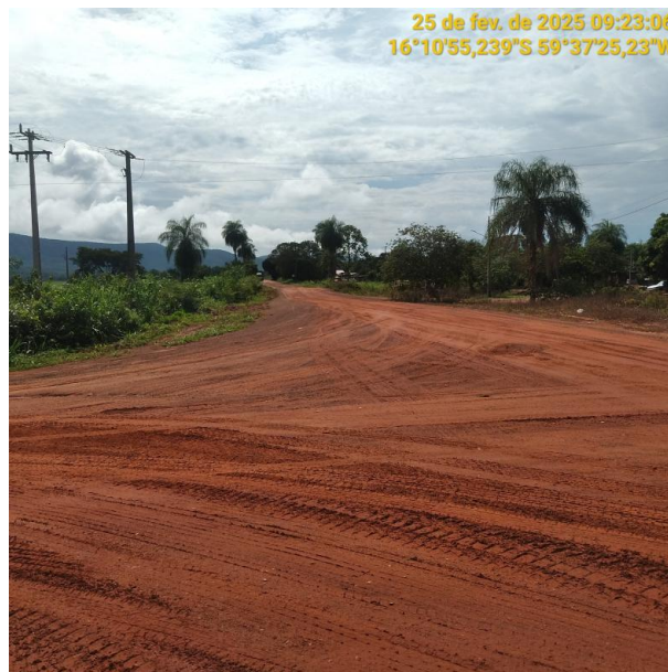
Foto 50 – Final Trecho MT-473 e Início Trecho MT-265 município de Pontes e Lacerda-MT.