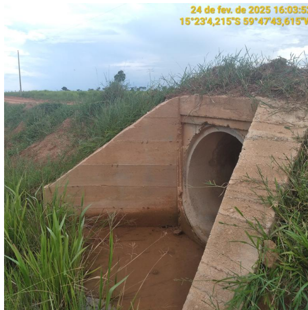
Foto 28 – Bueiro 09 - Trecho não pavimentado MT-245 município de Pontes e Lacerda-MT.