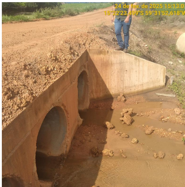
Foto 16 – Bueiro 03 do trecho não pavimentado MT-245 município de Pontes e Lacerda-MT.