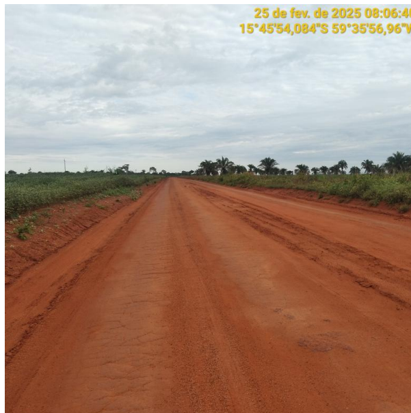
Foto 38 – Trecho não pavimentado MT-473 município de Pontes e Lacerda-MT.