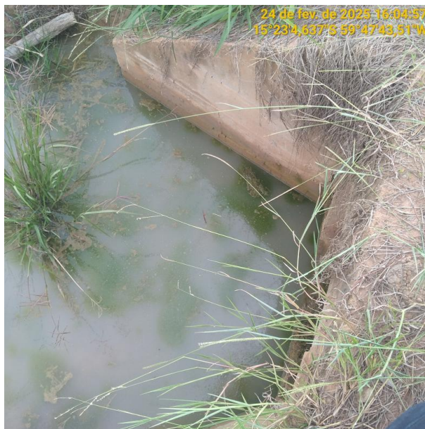
Foto 30 – Bueiro 09 - Trecho não pavimentado MT-245 município de Pontes e Lacerda-MT.