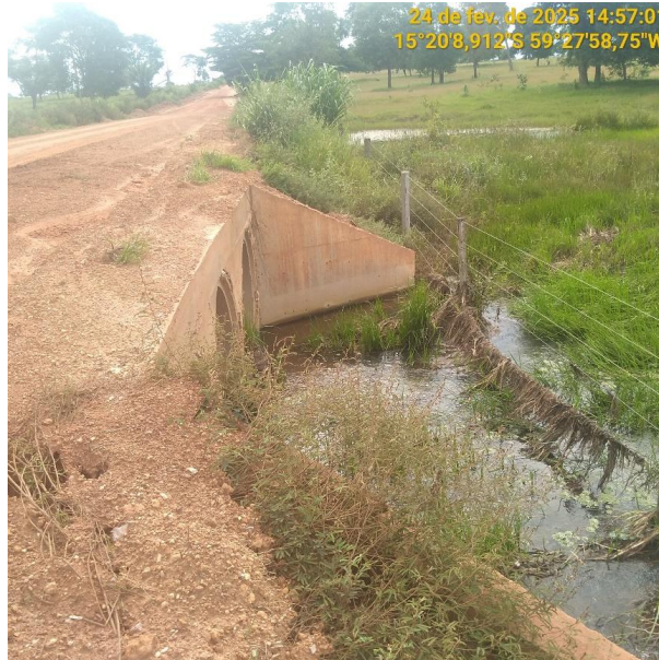
Foto 09 – Bueiro 02 do trecho não pavimentado MT-245 município de Pontes e Lacerda-MT.