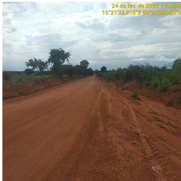
Foto 02 - trecho não pavimentado MT-245 município de Pontes e Lacerda-MT.