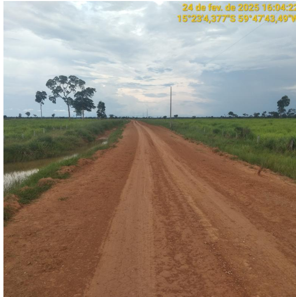
Foto 31 – Trecho não pavimentado MT-245 município de Pontes e Lacerda-MT.