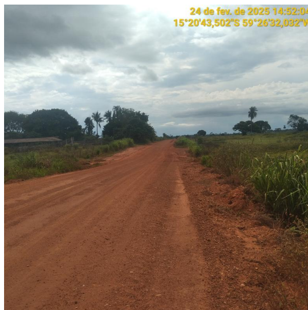
Foto 06 – Trecho não pavimentado MT-245 município de Pontes e Lacerda-MT.