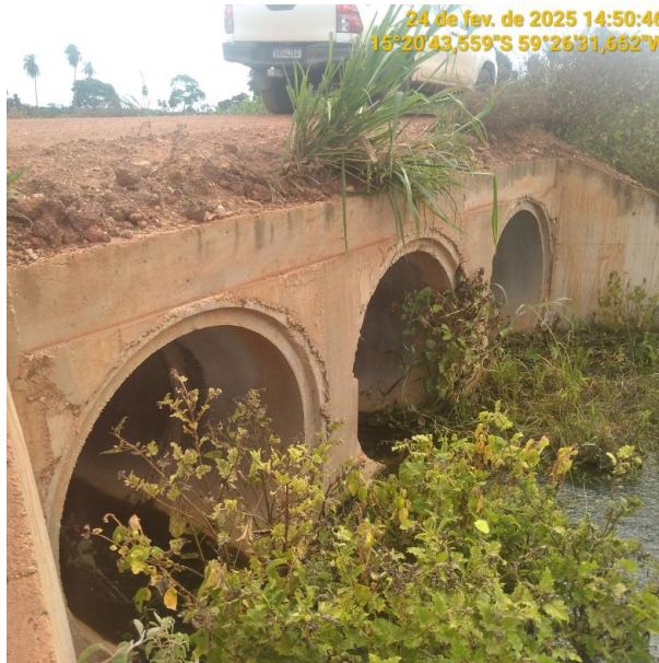
Foto 03 – Bueiro 01 do trecho não pavimentado MT-245 município de Pontes e Lacerda-MT.