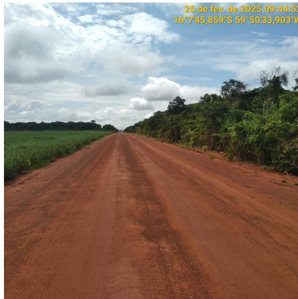
Foto 54 –Trecho não pavimentado MT-265 município de Pontes e Lacerda-MT.