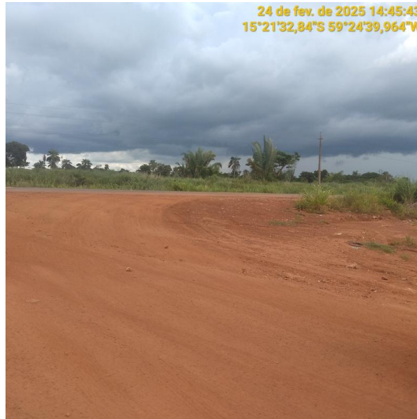
Foto 01 - Início do trecho não pavimentado MT-245 município de Pontes e Lacerda-MT.