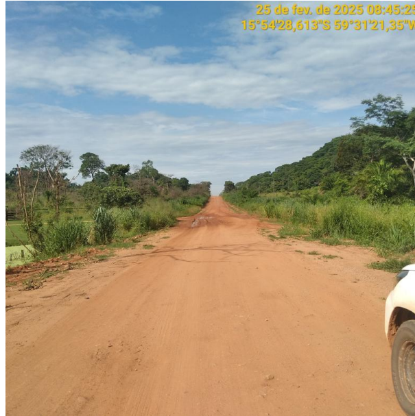
Foto 45 –Trecho não pavimentado MT-473 município de Pontes e Lacerda-MT.