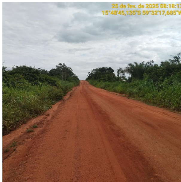
Foto 40 –Trecho não pavimentado MT-473 município de Pontes e Lacerda-MT.