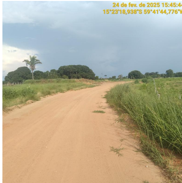
Foto 27 – Trecho não pavimentado MT-245 município de Pontes e Lacerda-MT.