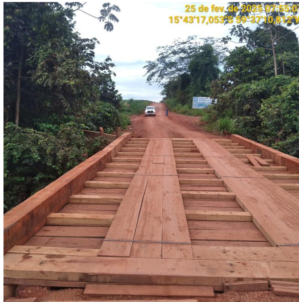
Foto 37 – Início do Trecho não pavimentado MT-473 município de Pontes e Lacerda-MT.