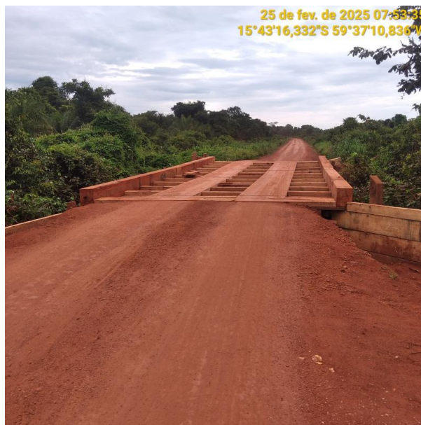
Foto 36 – Início do Trecho não pavimentado MT-473 município de Pontes e Lacerda-MT.