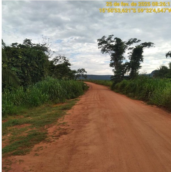
Foto 43 –Trecho não pavimentado MT-473 município de Pontes e Lacerda-MT.