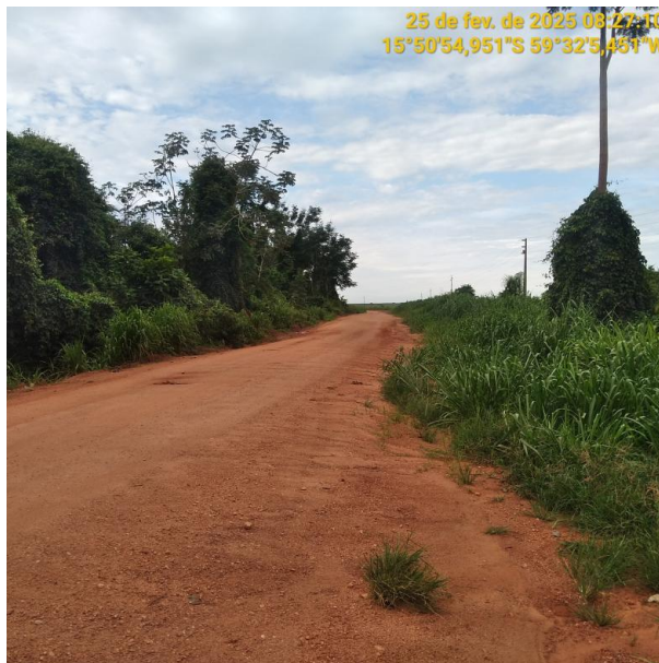
Foto 44 –Trecho não pavimentado MT-473 município de Pontes e Lacerda-MT.