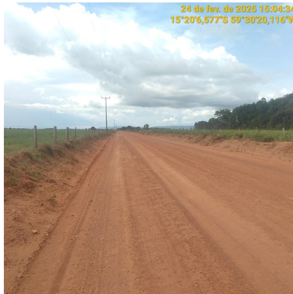
Foto 12 – Trecho não pavimentado MT-245 município de Pontes e Lacerda-MT.