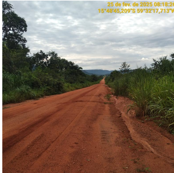
Foto 41 –Trecho não pavimentado MT-473 município de Pontes e Lacerda-MT.