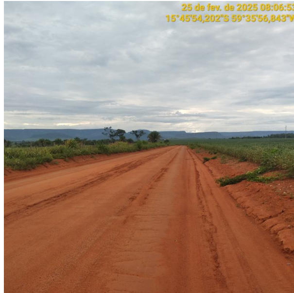
Foto 39 –Trecho não pavimentado MT-473 município de Pontes e Lacerda-MT.