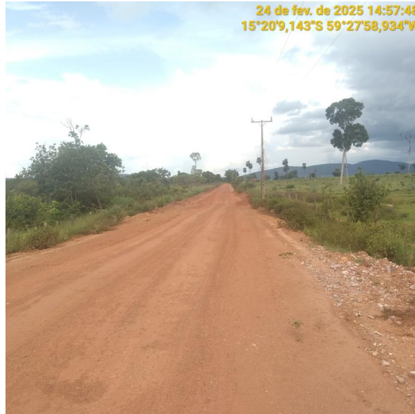
Foto 11 – Trecho não pavimentado MT-245 município de Pontes e Lacerda-MT.