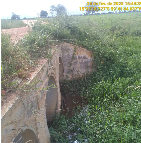
Foto 23 – Bueiro 08 - Trecho não pavimentado MT-245 município de Pontes e Lacerda-MT.